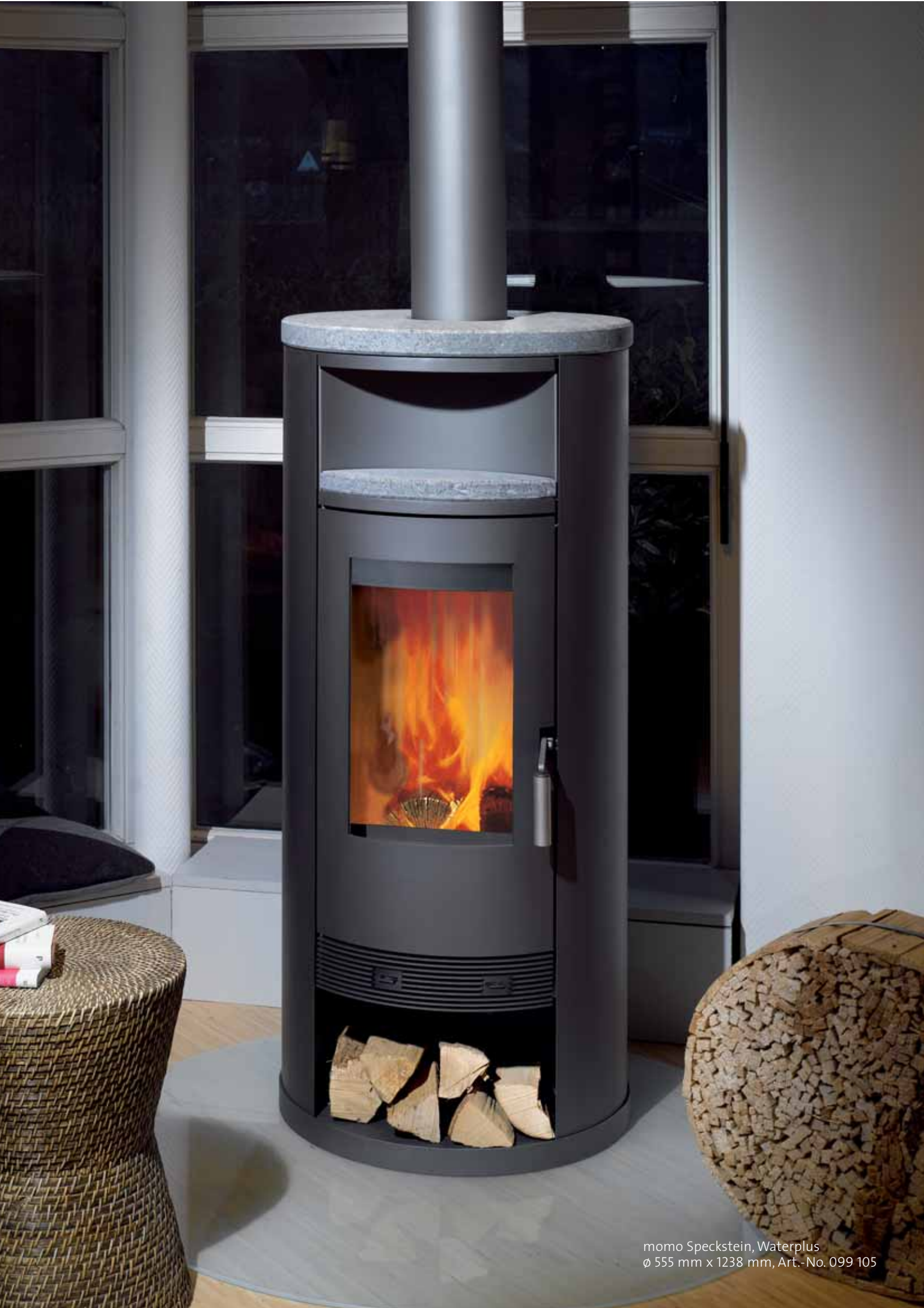
momo Speckstein, Waterplus ø 555 mm x 1238 mm, Art.-No. 099 105