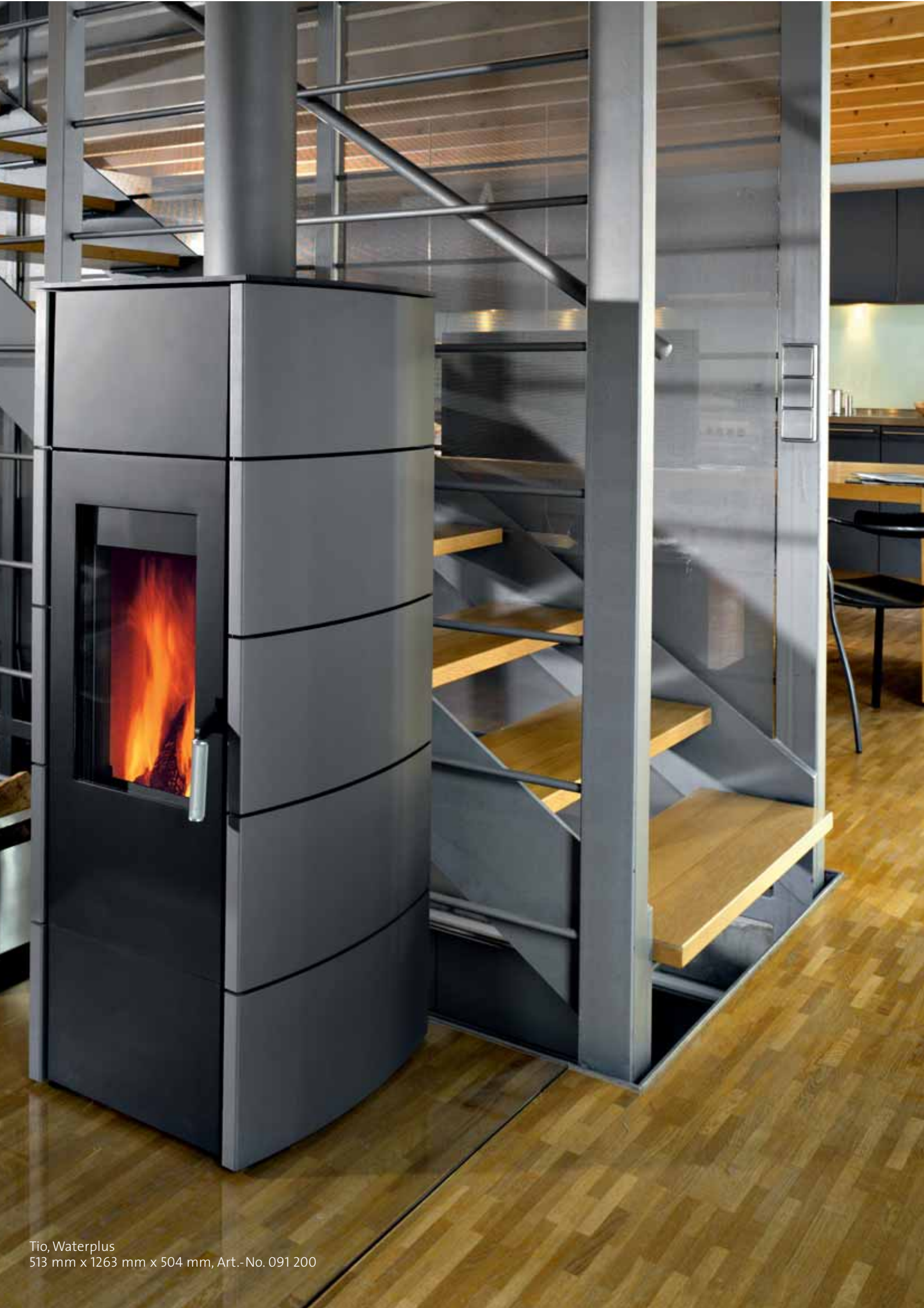
Tio, Waterplus 513 mm x 1263 mm x 504 mm, Art.-No. 091 200